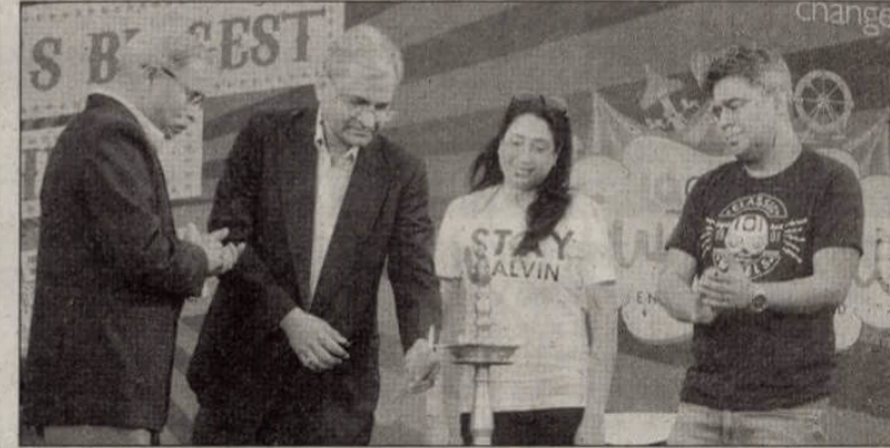
आई क्यू सिटी फन उत्सव 2016 के द्वितीय संस्करण का उद्घाटन करते वरिष्ठ अधिकारी व कलाकार